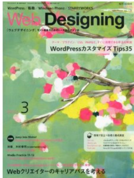
2012年2月に出版 Web Designing 2012年3月号