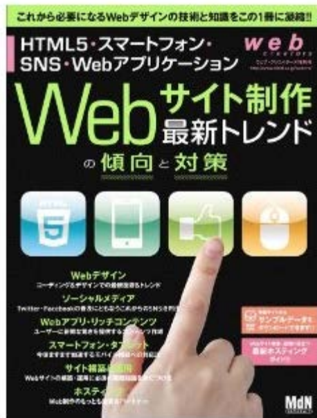
2012年1月に出版 web creators特別号 Webサイト制作 最新トレンドの傾向と対策